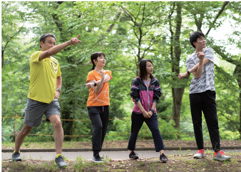
目指すは「インテリジェントアスリート」