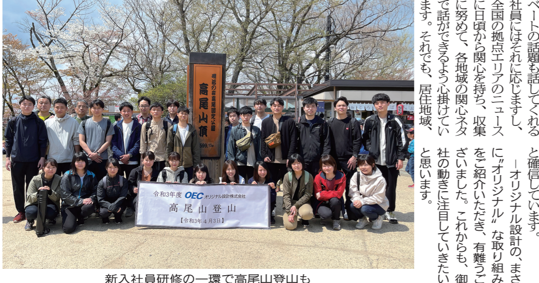
新入社員研修の一環で高尾山登山も

「改革」を軌道に乗せるためには、様々な苦悩もあって、思い切った決断が必要だ。その中で、自分自身が「改革」の推進者として、率先的に行動することが重要だ。また、改革の推進には、社員の理解と協力が不可欠だ。改革の推進には、社員の理解と協力が不可欠だ。