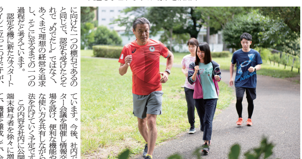
一歩ずつ理想に向かって進んでいる

「健康経営の先に見えてきた理想の形は、ウェルビーイング経営です。健康経営は、従業員の健康を維持し、生産性を向上させることが目的です。一方、ウェルビーイング経営は、従業員の健康を維持し、生産性を向上させるだけでなく、従業員の生活の質を向上させることが目的です。