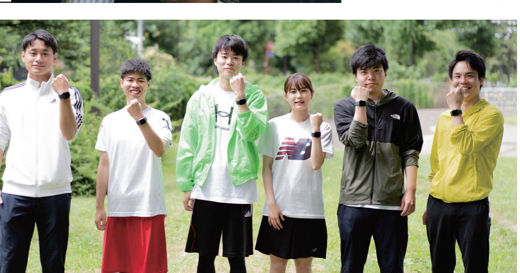
私達もウェアラブル端末を活用中